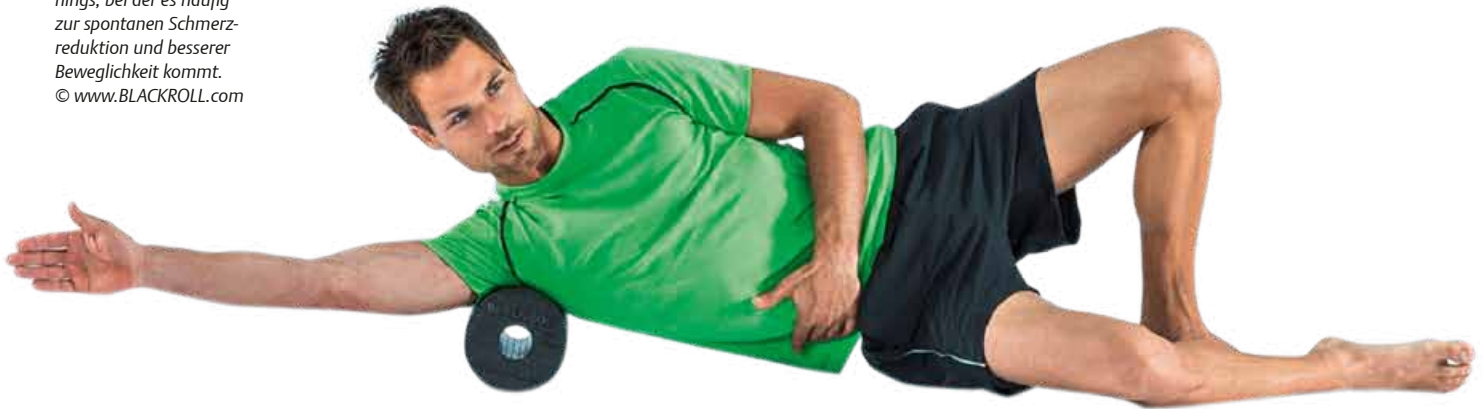
Abb. 2 Faszienrolle: Eine Variante des Faszientrainings, bei der es häufig zur spontanen Schmerzreduktion und besserer Beweglichkeit kommt.

Neben stoffwechselaktivierenden Maßnahmen und einem angepassten Dehnprogramm kommen hier v. a. Maßnahmen zur Verbesserung der Propriozeption infrage. Zwischen der Schmerz Wahrnehmung und der Propriozeption zeigt sich ein gegensinniger Zusammenhang: Je weniger Gespür für Bewegung im Rücken vorhanden ist, desto größer die Wahrscheinlichkeit, an Rückenschmerzen zu erkranken. Andersherum ist es dasselbe: Je größer der Schmerz, desto weniger werden feine Bewegungen wahrgenommen. Eine Schulung der Wahrnehmung und Feinkoordination im Sinne eines Fascial Refinements begegnet diesem Defizit und kann mit einem Elastizitätstraining ergänzt werden, sobald die Faszie schmerzfrei bewegt werden kann.