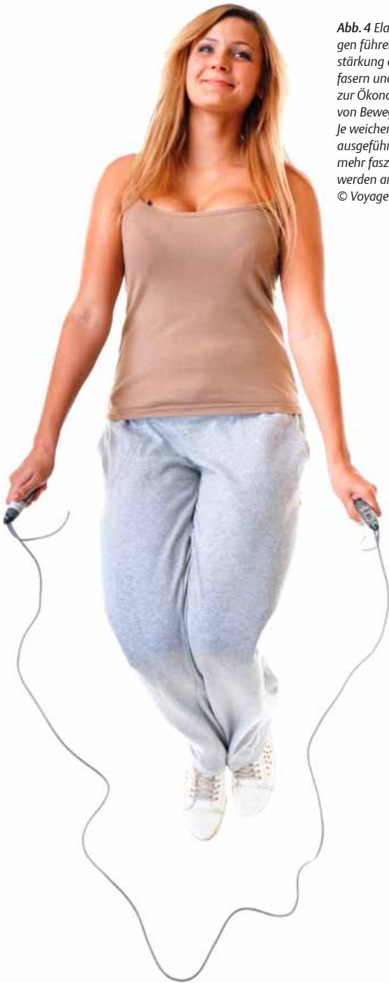
Abb. 4 Elastische Übungen führen zu einer Verstärkung der Kollagenfasern und tragen damit zur Ökonomisierung von Bewegungen bei. Je weicher die Bewegung ausgeführt wird, desto mehr fasziale Strukturen werden angesprochen.

Körperwahrnehmung und koordinative Fähigkeiten sind untrennbar mit einem Faszien-training verbunden.