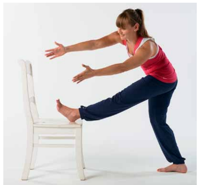
Abb. 3 Aktiv-dynamisches Dehnen beinhaltet eine innere Länge (Aufspannung) und ein Bewegen in die oder in der Dehnposition. Am Beispiel der rückwärtigen Funktionskette werden hier Arme und Beine nach vorne und das Becken/LWS aktiv nach hinten geführt.

Geschwindigkeit von etwa 1 cm pro Minute als optimal herausgestellt, um das Gewebswasser von seinen Bindungsstellen lösen und nach dem Druck besser binden zu lassen [13]. Die nach dem Rollen erhöhte Wasserbindung im Gewebe wird auf das Ausschwemmen freier Radikale und die damit freigelegten Bindungsstellen zurückgeführt [14]. Vom kosmetischen Nutzen abgesehen lässt dieser erhöhte Wassergehalt die Faszien elastischer und rückstellkräftiger werden, was der sportlichen Leistungsfähigkeit zugutekommt. Allerdings ist langsames Rollen vor dem Sport genauso unangebracht wie langsames Dehnen: Beide Verfahren führen zu einer akuten Muskeldetonisierung und sollten deshalb erst nach dem Sport angewandt werden.